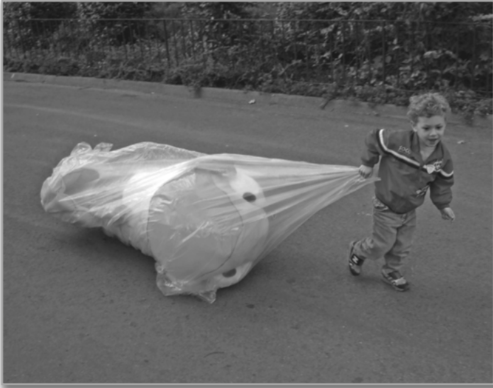
Logan, eğlence parkında kocaman bir peluş hayvan taşımının tadını çıkarırken. Yaz 2007.