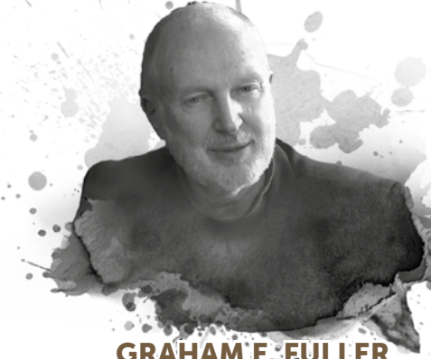
GRAHAM E. FULLER

Adres: Kavaklıdere Mh. Bardaçık Sk. No: 8/1 Küçükesat, Ankara • Telefon/Faks: (312) 434 44 64 E-Mail: info@eksikitaplar.com • Web: www.eksikitaplar.com • Sertifika No: 25787